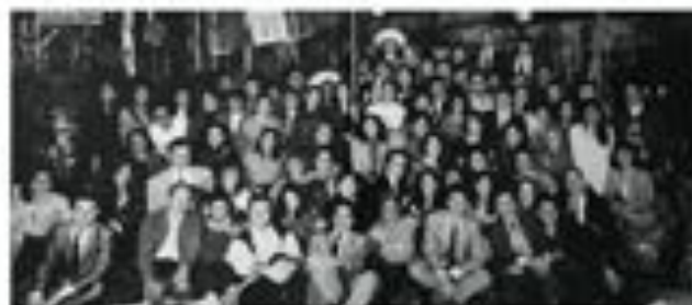
Fin de carrera Admin 91

El nivel de exigencia fue siempre alto y ningún maestro fue consentidor. Sabíamos que habría exámenes departamentales e llegaría la entrega de algún reporte o trabajo y, al cabo del tiempo y en la vida laboral, nos hemos dado cuenta de que así pasa en el mundo real. Desde aquellos tiempos como estudiantes, el manejo del estrés comenzó a ser parte de nuestras habilidades.