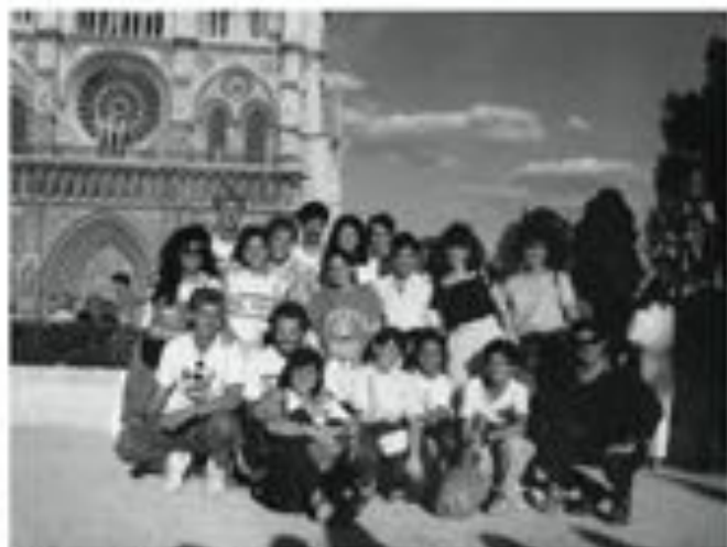
Mochilazo en Europa a mitad de carrera