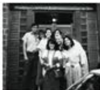
La Guadalupeana en Coahuacán